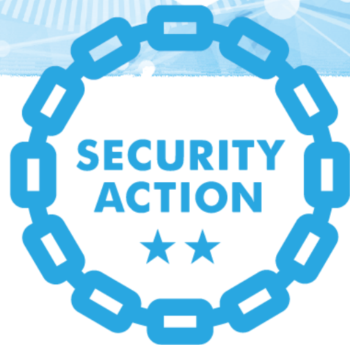
セキュリティ対策自己宣言

「SECURITY ACTION」は中小企業自らが、 情報セキュリティ対策に取り組むことを自己宣言する制度です。 「中小企業の情報セキュリティ対策ガイドライン」の実践を ベースとした2段階の取り組み目標を用意しています。 自社の情報セキュリティを高め、強い組織を目指しましょう。