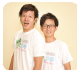
MC 群馬住みます芸人 アンカンミンカン

異性の参加者全員と個別にお話できる企画を盛り込み、 お互いの人柄や気持ちを分かり合える 素敵なパートナーを見つけていただく婚活イベントです。 良縁を祈願するだるまの絵付け体験などの レクリエーションを通じた交流のほか、 カップリングも行います。